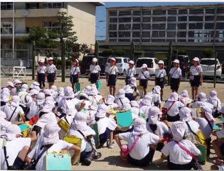
実行委員が始めの会や終わりの会で活躍しました。

学校に帰って来てから、メモしたことをまとめたり、気に入ったところについてカードに書いたりしました。永保寺についてたくさん学ぶことができとてもよい機会になりました。秋に第2回目の永保寺調査隊に行くのがとても楽しみです。