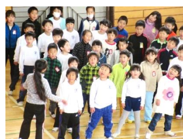
各学年から、心のこもったメッセージと歌声の贈り物。