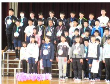
6年生は、いよいよ卒業を実感したかのような穏やかな表情。