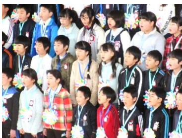
最後は、迫力ある6年生の合唱。卒業式が楽しみです。