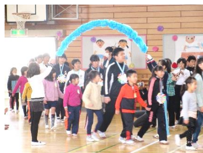
1年生と手をつないで6年生が入場

5年生は、学校のリーダーを確実に引き継ぐことを目標にして、会の計画と準備、当日の運営に力を合わせて取り組みました。また、どの学年も1年間の成長を、語りや合唱の姿で披露しました。最後は、6年生の力強い合唱で締めくくり、たいへん感動的な会になりました。