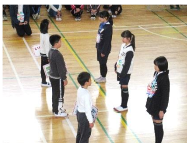
5年生は、3つの伝統を6年生から引き継ぎました。