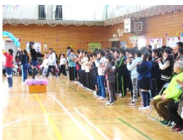
5年生は「威風堂々」を合奏して6年生の入場に華を添えました。