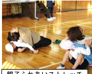
親子ふれあいストレッチ

親子がペアになってストレッチをするなど、ふれあいのひと時を過ごしました。今年度の親子行事はこれが最後です。学年委員の皆様、ありがとうございました。