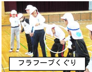
フラフープくぐり

なかよし班の班長さんや6年生の子たちは、班のみんなをうまくまとめて、みんなで楽しむ雰囲気をつくっていました。自分たちの手で楽しい行事を創りあげることができました。