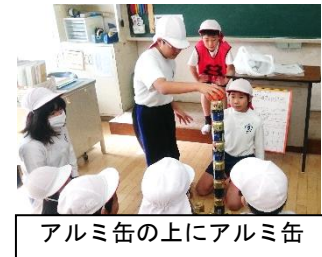
アルミ缶の上にアルミ缶