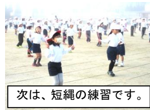
次は、短縄の練習です。

学級ごとに練習を重ねて臨んだ大縄大会。自分たちで立てたあてや目標に向かって協力する、努力する姿がたくさん見られました。