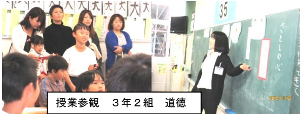
授業参観 3年2組 道徳