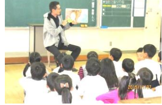
読み聞かせ活動(学年委員会) 目を輝かせて聞いていました。

本当に多くのご参加をいただき、ありがとうございました。また、読み聞かせを担当していただいたPTAの学年委員の皆様、教育講演会の会場準備や当日の進行をしていただいた研修委員の皆様、駐車場整理をしていただいた母親委員の皆様にはご協力いただき、ありがとうございました。