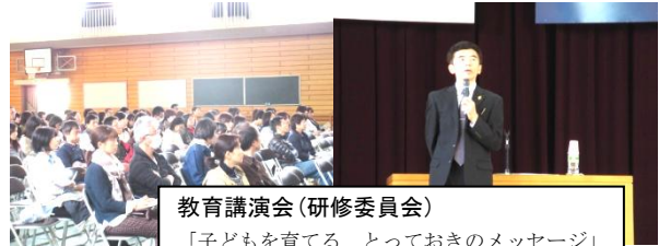
教育講演会(研修委員会)