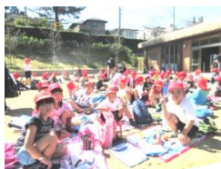
1年生 東山動物園 「みんなで食べたお弁当、楽しかった。」