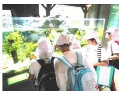
4年生 アクアトト 「総合や理科の学習の参考になりました。」