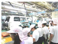
5年生 パジェロ製造 「自動車製造のすごさを実感しました。」