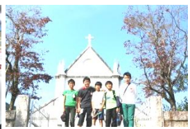
6年生 明治村 「クイズラリーを通して楽しく学びました。」