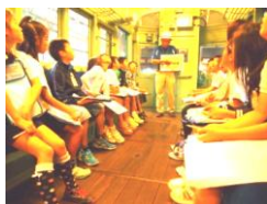
3年生 瀬戸蔵ミュージアム 「とってもよくお話を聞きました。」