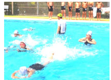
3年生水泳教室の様子