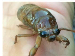
校長 蟬の幼虫です

寒い日で、風が強く吹いていました。こんなに寒い日に、しかもこんなに早く羽化してしまってよいものかと心配になりました。しかし、この蟬も自然の掟の中で精一杯生き、自らの成長のために一步一步なすべきことを命がけで行っているのだと感じました。