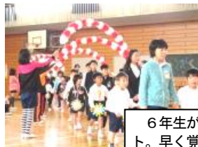
6年生が、校歌の歌詞の掲示物をプレゼント。早く覚えて、一緒に歌いましょう。

6年生に手をひかれながら入場した1年生。最初はドキドキしている様子でしたが、各学年の心温まる歌や呼びかけに、最後は笑顔で応えていました。