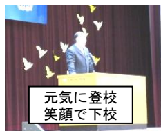
元気に登校 笑顔で下校