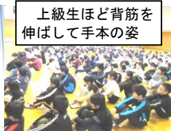
上級生ほど背筋を 伸ばして手本の姿