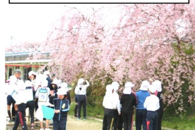
桜の花の観察をする4年生

1年生は、嬉しい気持ちを抑えきれず、素直に喜びはしゃいでいました。2年生は、新1年生を迎えてお兄さんお姉さんらしくなりました。この会でも、準備から司会進行なども含めて、6年生が全校を立派にリードすることができ、充実した会にすることができました。