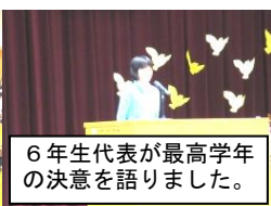
6年生代表が最高学年 の決意を語りました。