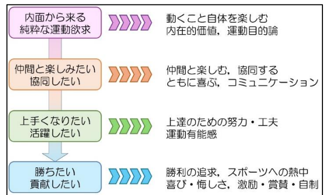
図2. 子どもの運動欲求

次に、子どもの運動欲求の段階について示します。図2は、私が子どもの運動欲求の段階をまとめたものです。初期段階では、子どもは内面から来る純粋な運動欲求に従って運動をします。この段階では、純粋に動くこと自体が楽しくてたまらない様子が見て取れます。多くは、幼児期から児童期前半ぐらいがこの段階にあたると思います。次の段階では「仲間」という運動において、とても大切なキーワードが出てきます。一人遊びの段階から、徐々に仲間との運動を楽しむようになります。友達と一緒に動くことが楽しくなり、一緒に遊ぶ友人の存在がとても大きくなります。3つ目と4つ目の段階は、運動に対してかなり前向きになってきた段階と言えます。誰でも上手になりたいという気持ちは芽生えます。そうすると、努力や工夫というものも見られ、それが成果となって現れることで有能感を獲得します。この段階への移行は意外とハードルが高く、自らの成果を上手に有能感へと変換できれば4段階目へのスムーズな移行が期待できます。子どもは言語的理解よりも体得が大切ですので、工夫したことやできたことを認めてあげて有能感を高めてあげて欲しいと思います。4段階目は、かなり高次の段階ですが、喜びや悔しさ、激励・賞賛などは運動においてとても大切な要素ですので、中学生や高校生ぐらいになれば、このようなことの大切さにも気づいてほしいと思います。