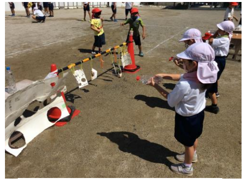
《過去の学習の様子》

3日には、持たせていただいた容器で水鉄砲遊びをしました。次は、楽しい的を工夫する学習を行います。10日に計画を立てるので、それを見て、的になる物（牛乳パックやペットボトル、トレー、カップ麺の容器、色油性ペン、ひも、かん）など、家庭にあるもので可能な範囲での準備をお願いします。ご協力をお願いします。