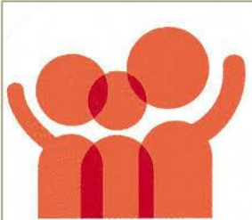
「家庭の日」シンボルマーク