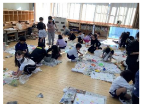
〈1年生図工作ったんココココの様子〉

人や社会が多様化していく中、様々な変化やちがいを理解しながら、自らの持ち味を大切にし、誰もが安心安全に過ごせる学校や家庭での環境が、子供の自己肯定感や思いやり心につながっていくと感じました。