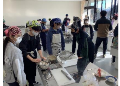
〈6年生調理実習の様子〉

令和7年が始まり、すでに1か月が過ぎようとしています。昨年末に市内の小中学校では、インフルエンザをはじめとする感染症が流行し、冬休み明けも感染拡大が懸念されていました。現在も全国的にみると、岐阜県はインフルエンザ等の感染者の割合が高いようですが、市内小中学校の感染状況は、昨年末に比べれば落ち着いています。本校の「池田っ子」は寒さにも負けず元気に登校し、新年に決めた目標に向かって、授業や学校生活に励んでいます。